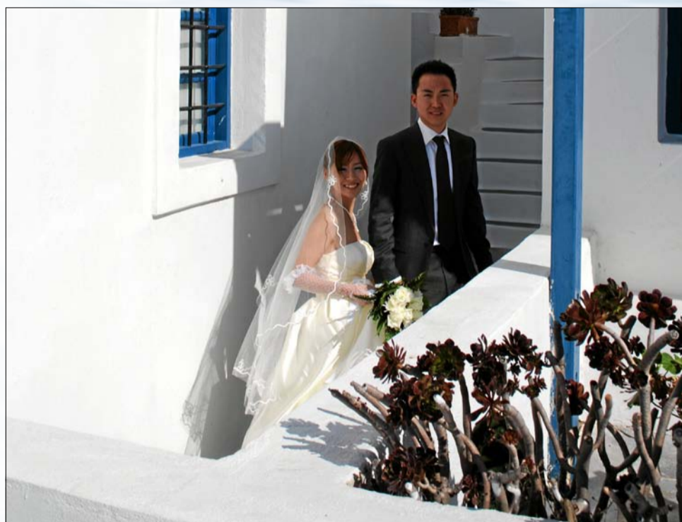
DE ROMANTISKE OMGIVELSER får folk til at valfarte til Santorini for at blive gift på kraterkanten. Vi stødte ind i et japanskt par i billedskønne Imerovigli.