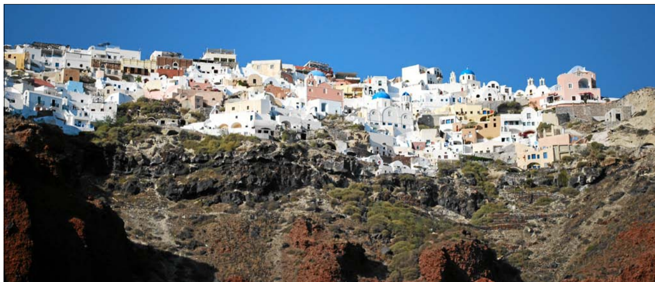
MANGE HUSE PÅ SANTORINI ligger i klynger på kraterranden. Her er det Oia.