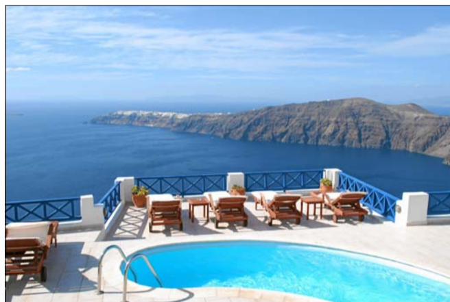
I IMEROVIGLI ligger de mange, små hoteller direkte ud til kraterkanten.