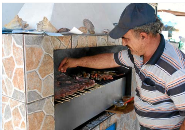
PÅ NABOØEN THIRASSIABOR 200 mennesker. Mad og udsigt fra de små, simple restauranter ved den lille havn er uovertruffen.