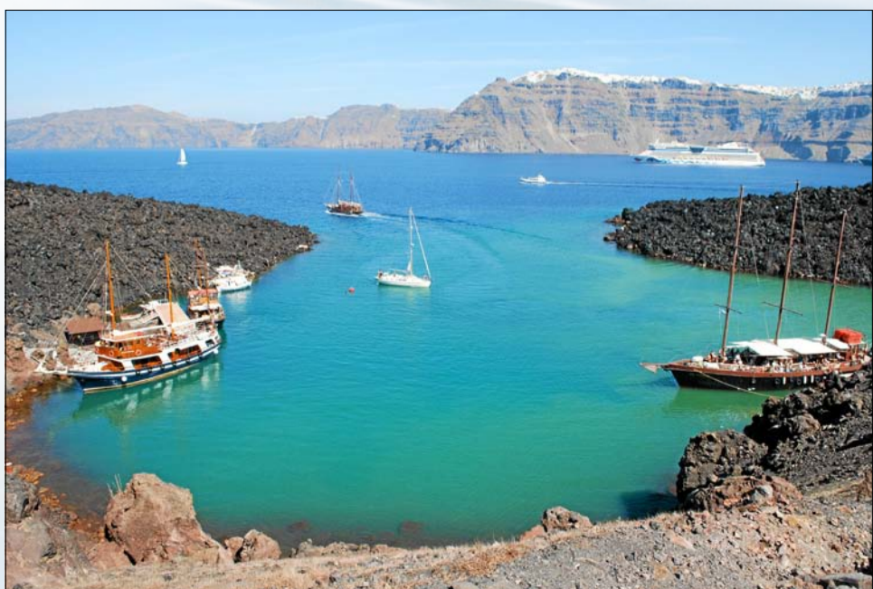
VULKANEN LUGTER stadig af svovl og damper. Da vi lægger til på vulkanøen Nea Kameni sker det i en lille smuk vig. Det tager ca. 40 minutter at gå af de sorte stier op til vulkanen.